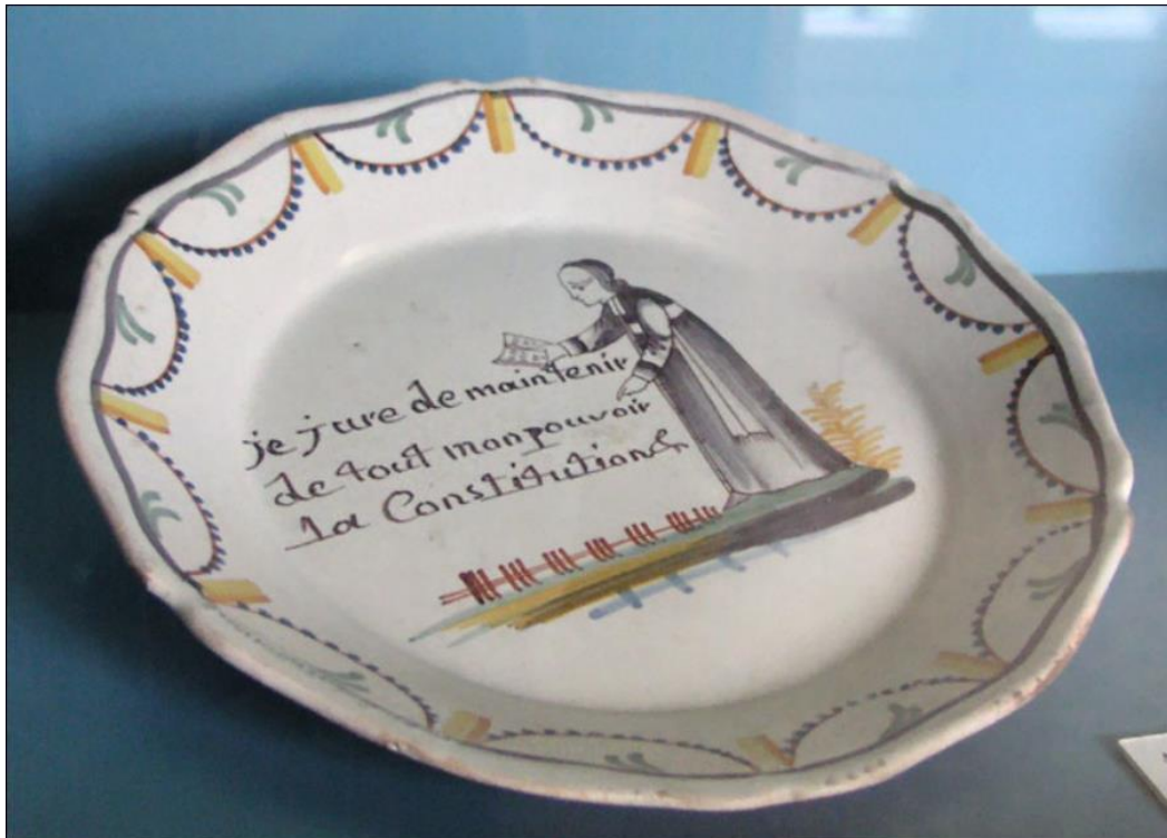
Възпоменателна чиния от 1790 г. 1

Невъзможно е да се изчисли дори и приблизителната част на свещениците, които полагат клетва и на тези, които отказват да сторят това. Отделни автори определят числото на незаклетите свещеници на 50 000. Броят на заклетите свещеници е най-голям в Париж – революционният център на Франция, но в провинцията антиреволюционните настроения ескалират, особено в селата, където обществата са патриархални.