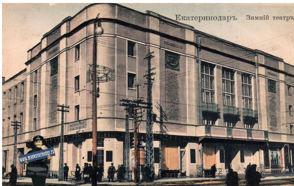
Приложение № 2. Здание Зимнего театра (фото до войны)

Было восстановлено здание Зимнего театра, построенного в 1909 году по проекту «отца русского модерна» Ф. Шехтеля. Строительными работами руководил именитый кубанский архитектор А. Козлов. Фасад, был облицован ровной цементной штукатуркой, придававшей сооружению невесомость, воздушность [8]. Это впечатление еще больше усиливали три вертикальных столбца с перечнем имен великих композиторов и драматургов всех времен и народов, три высоких окна с ажурными балкончиками и венчающий постройку широкий карниз с узорными гирляндами, едва выступающий над фасадом (приложение № 2).